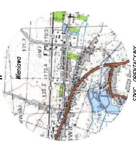
WIENIAWA SZKIC ORIENTACYJNY skala 1:25 000

Projekt został wykonany na mapie elektronicznej do celów projektowych zarejestrowanej w Ośrodku Geodezyjnym Starostwa Powiatowego w Przysusze. Identyfikator: P.1423.2017.974 z dnia 14 listopada 2017 r.