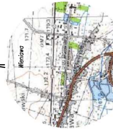
SZCZEGÓLNY WIDOK Skała 1:25 000